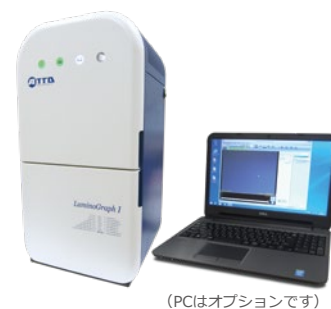
(PCはオプションです)

ケミルミネッセンス高感度撮影 (プロットング膜の発光撮影) (オプション) EtBr, SYBR, その他DNA蛍光染色ゲル撮影 (UV, シアン光源) (オプション) CBB染色, 銀染色などのタンパク質色素染色ゲル撮影 (白色透過光源) (オプション) バンド・スポットの定量, 分子量計測