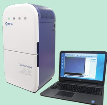
ケミルミ・ゲル撮影装置 Luminograph I/II (Luminograph III は非対応)