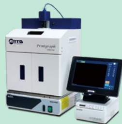
ゲル撮影装置 Printgraph Classic