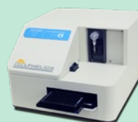
発光プレートリーダー Phelios