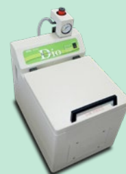
生細胞リアルタイム発光 測定装置 (Dish タイプ) Kronos Dio