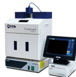
(UV照射装置, プリンターはオプションです)

EtBr, SYBR, その他DNA蛍光ゲル撮影 (UV照射装置, シアン光源からオプション選択) CBB染色, 銀染色などのタンパク質色素染色ゲル撮影 (白色透過光源をオプション選択) 撮影画像をUSBメモリへ保存 撮影画像をプリンターで印刷 (プリンターをオプション選択) バンド・スポットの定量, 分子量計測 (解析ソフトCSAnalyzer4をオプション選択)