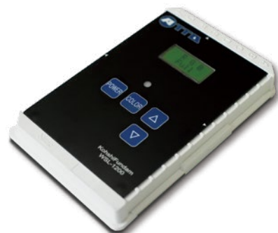
標準 LED 光源 KohshiFundam (光子ファンダム)