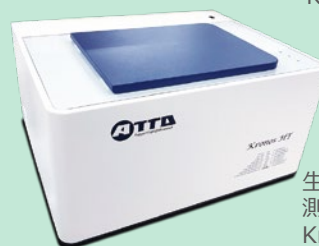
生細胞リアルタイム発光 測定装置 (Plate タイプ) Kronos HT